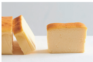
北海道クリームチーズ