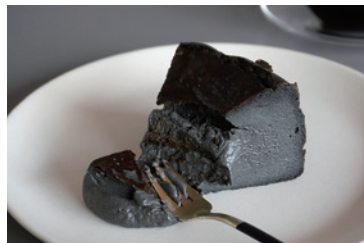
黒ごまバスク（フレーバーは時期によって変更）