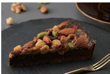
キャラメルナッツのタルト